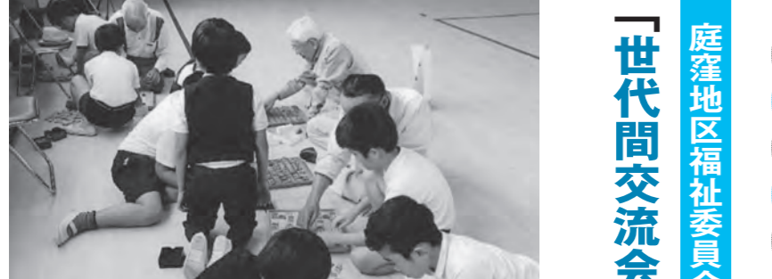
▲児童と将棋で対決!

庭窪小学校3年生との世代間交流が10月11日に行なわれました。 体育館で児童が「パプリカ」の曲に合わせてダンスを披露してくれました。 とても可愛かったです。次に伝承遊び(囲碁・将棋・あやとり・けん玉・お手玉・おはじき等)を各コーナーに分かれて遊びました。 その後給食の時間となり、児童に教室を案内してもらいました。 一緒に美味しくいただきました。 楽しく有意義な時を共に過ごし、元気をいただきました。 たった1日となりました。