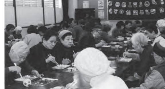
▲クリスマス弁当に初挑戦!

1 ①「いきいきサロン」②5月11日 2 ①「いきいきサロン」②5月11日 3 ①「いきいきサロン」②5月11日 4 ①「いきいきサロン」②5月11日 5 ①「いきいきサロン」②5月11日 6 ①「いきいきサロン」②5月11日 7 ①「いきいきサロン」②5月11日 8 ①「いきいきサロン」②5月11日 9 ①「いきいきサロン」②5月11日 10 ①「いきいきサロン」②5月11日