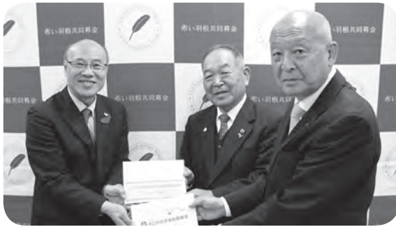
▲集まった募金は社協会長、民児協会長によって大阪府共同募金会に手渡されました