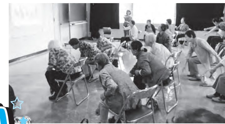
▲身体を動かしていつまでも健康に!

錦地区福祉委員会では、年に数回70歳以上の一人暮らしの方を対象とした「給食サービス」を行なっています。しかし、せっかくお集まりいただいているのに食事だけではもったいないなあと考え、本年度から食事前のちよとしたお楽しみ会をすることにしました。