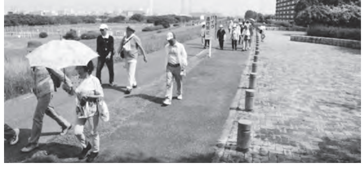
▲元氣いっぱい歩きます!

「普段から田植えをしているからねえ」と口数少なめに笑顔で返ってきた。やはり常に身体を動かすことは、年齢に関係なく足腰が丈夫で体力が衰えないのだと痛感させられ、疲労困憊の「歩こう会」となった。