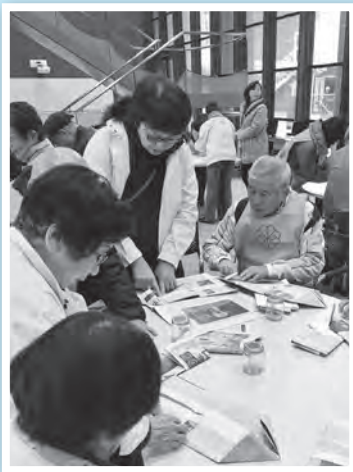
▲新聞紙スリッパ作り

今年もOIU(大阪国際大学)・OIC(大阪国際大学短期大学部)防災フェスタ2018を開催しました。地域住民、ボランティア、福祉委員、民生児童委員など265名の方が参加され、災害時に向けた講義や体験コーナーを行いました。お昼には炊き出しと昆虫食の試食体験といったイベントもあり、大盛況でした。