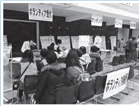
▲災害ボランティアセンター

今年もOIU(大阪国際大学)・OIC(大阪国際大学短期大学部)防災フェスタ2018を開催しました。地域住民、ボランティア、福祉委員、民生児童委員など265名の方が参加され、災害時に向けた講義や体験コーナーを行いました。お昼には炊き出しと昆虫食の試食体験といったイベントもあり、大盛況でした。